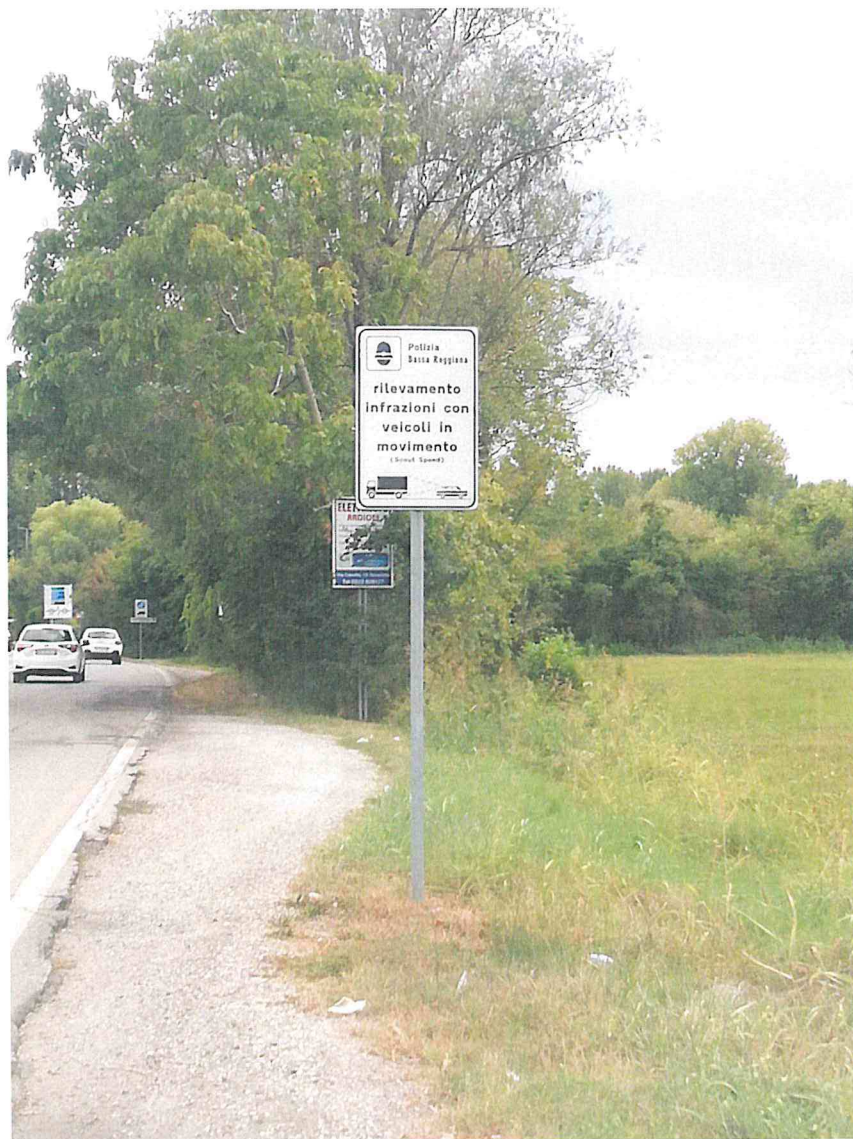
1. VIA SACCO E VANZETTI INT. STRADA CAVALCAVIA DIREZIONE NOVELLARA